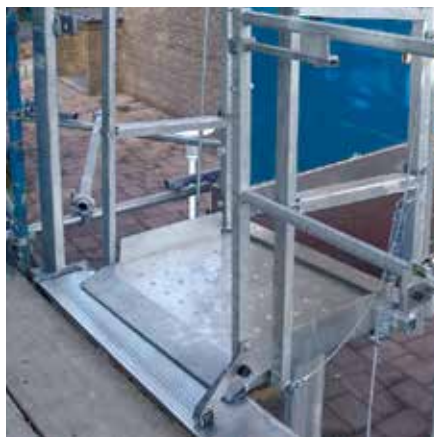
Lastesituasjon med åpen plattform, plattformlengde 0,60 m.