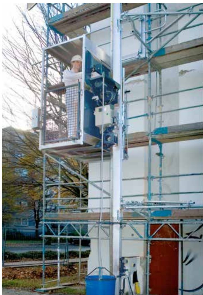
MX 320 med plattform 0,85 x 1,40 m