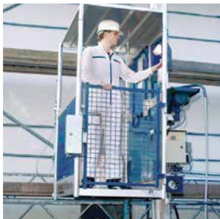
Hengslet port med elektromekanisk lås på inngangssiden og elektrisk overvåket lasterampe på utgangssiden.